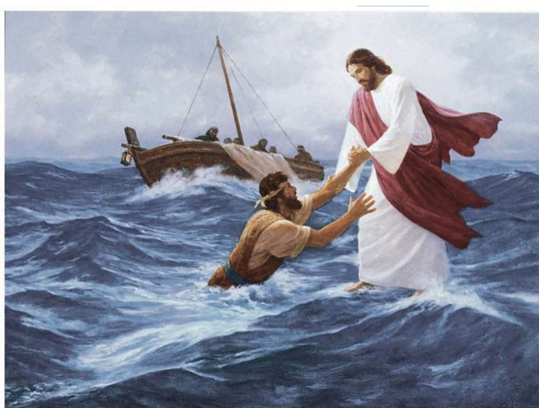
Lord, Save Me, by Gary Kapp